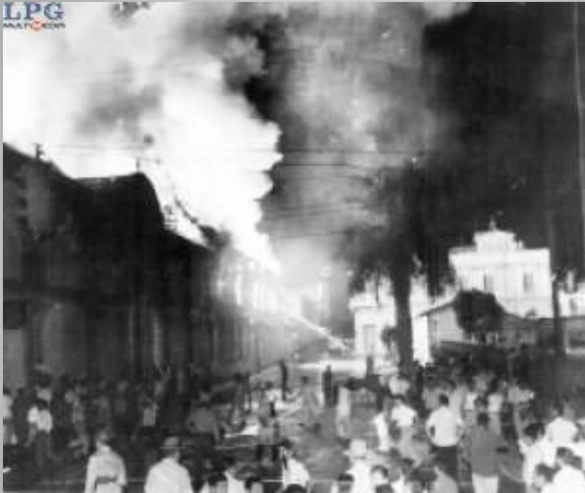
Incendio del edificio “La Casona”, sede de la Universidad de 1878 a 1955.