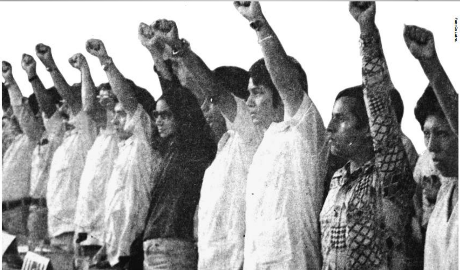
Líderes de la Coordinadora Revolucionaria de Masas (CRM), firmaron en la Facultad de Derecho de la Universidad de El Salvador un pacto de Coalición. San Salvador, 1980.

Firma del pacto de coalición con líderes de la Coordinadora Revolucionaria de Masas, 1980.