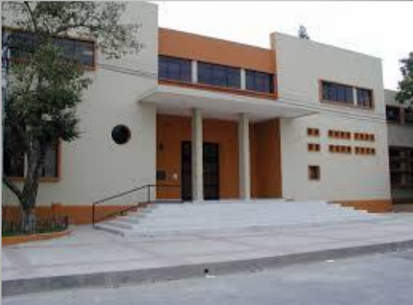
Fachada de la Facultad, luego de la reconstrucción para los Juegos Centroamericanos y del Caribe, 2002.