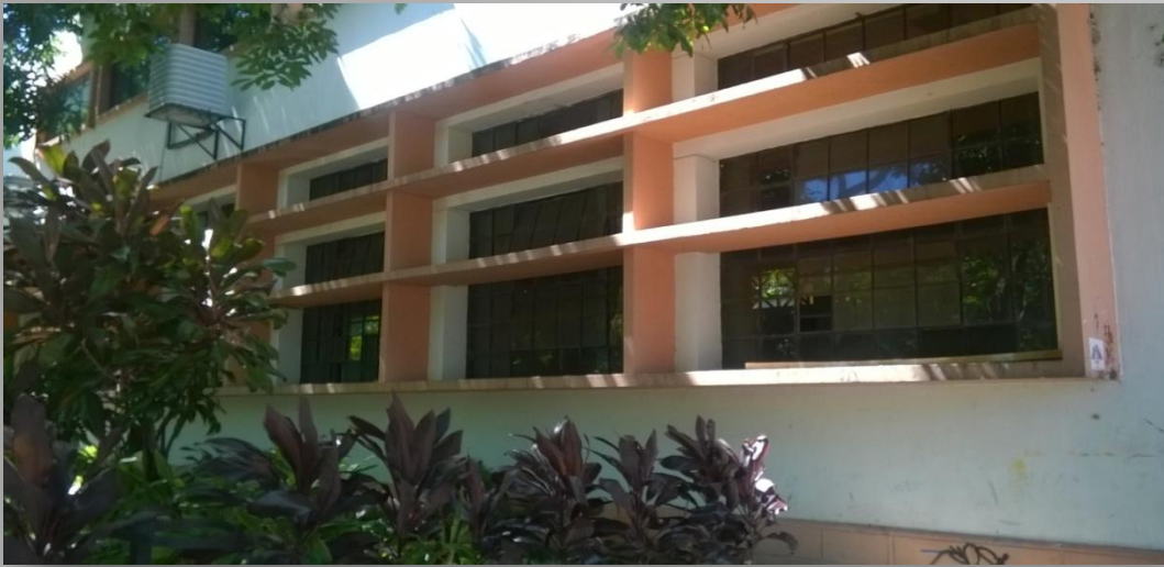
Fachadas laterales de la Facultad, 2014.