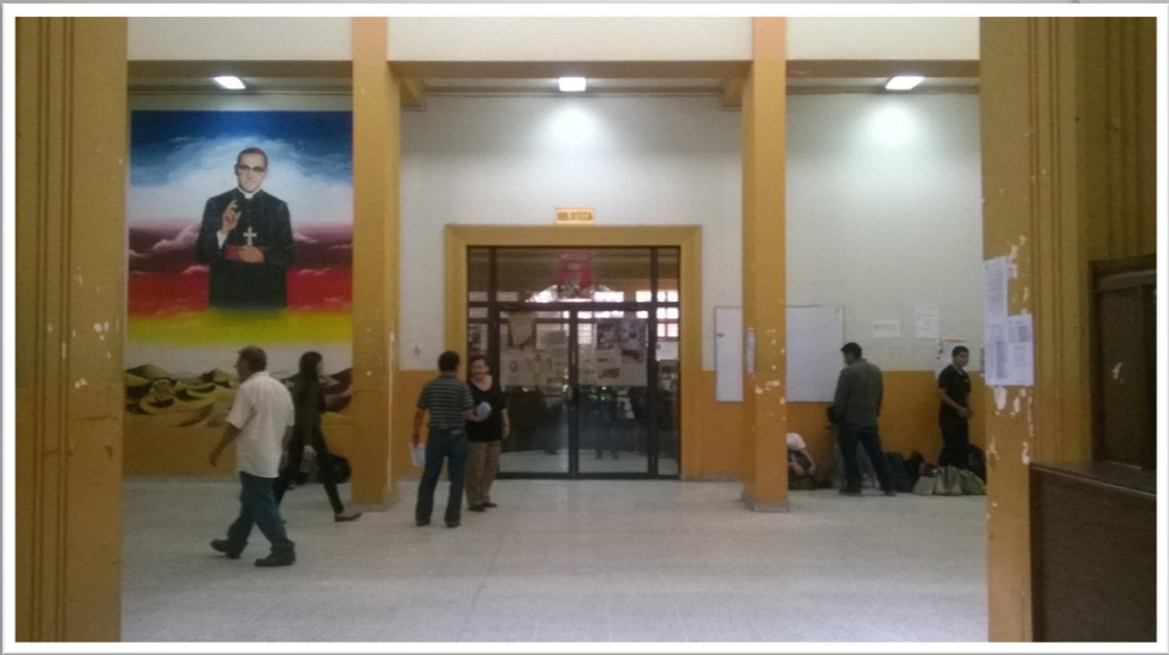
Biblioteca de la Facultad