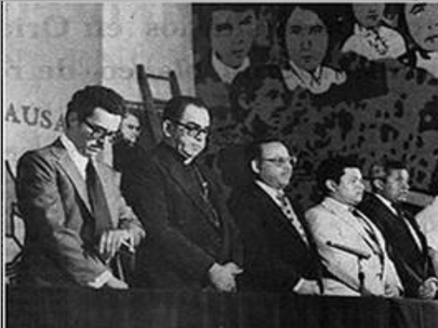
Entrega del Doctor Honoris Causa a Monseñor Romero, auditorio de la Facultad, 1980.