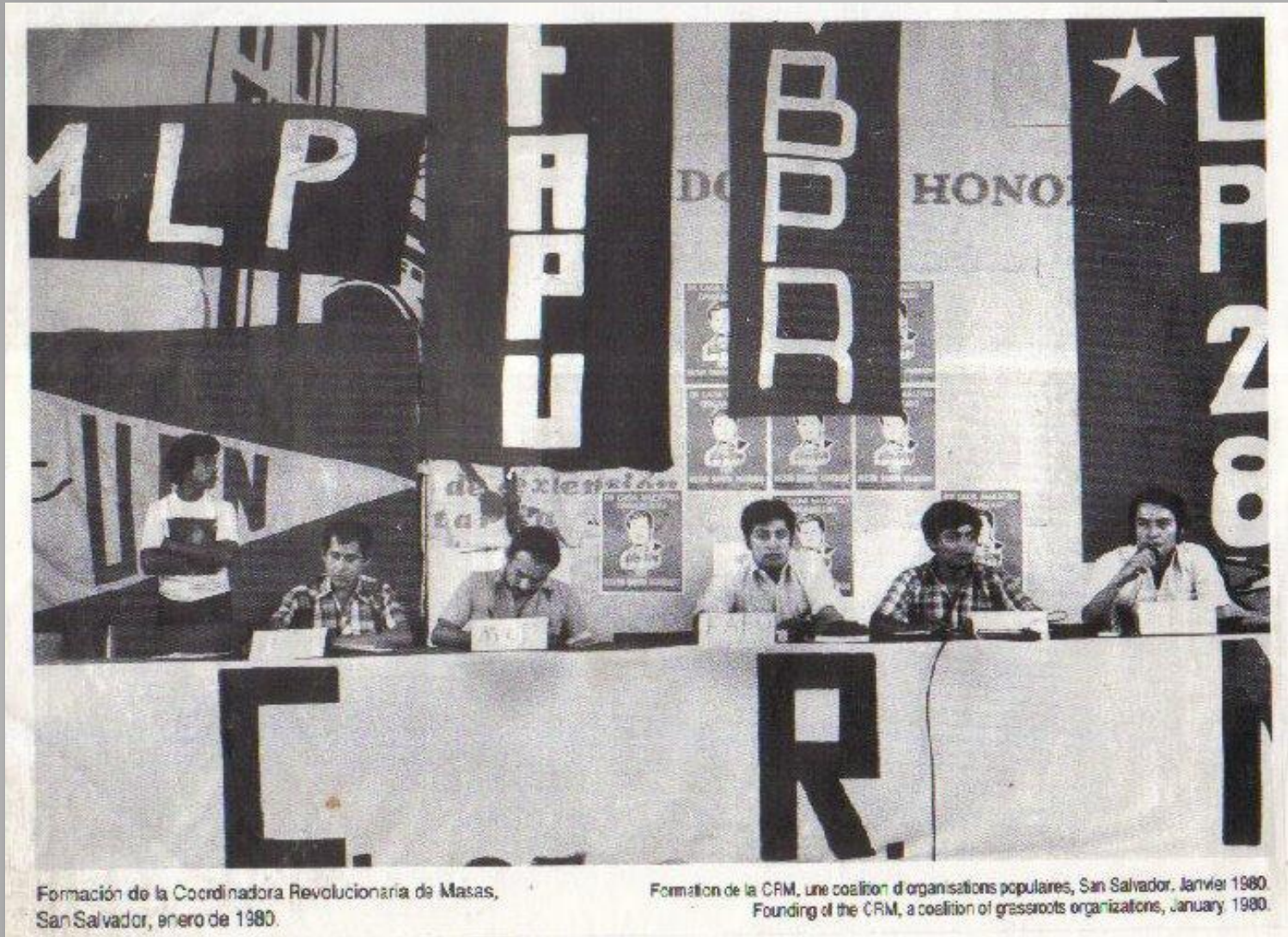
Formación de la Coordinadora Revolucionaria de Masas, San Salvador, enero de 1980.