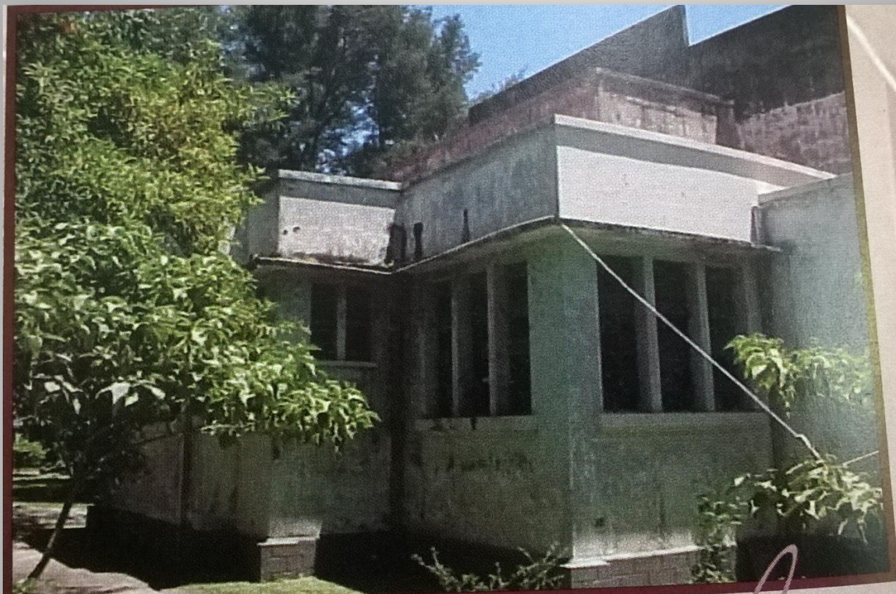
Vista posterior del edificio de la Facultad, aproximadamente en la década de los 80.