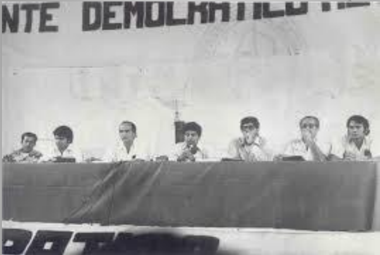
Reunión del Frente Democrático Revolucionario, en el auditorio de la Facultad, 1980.