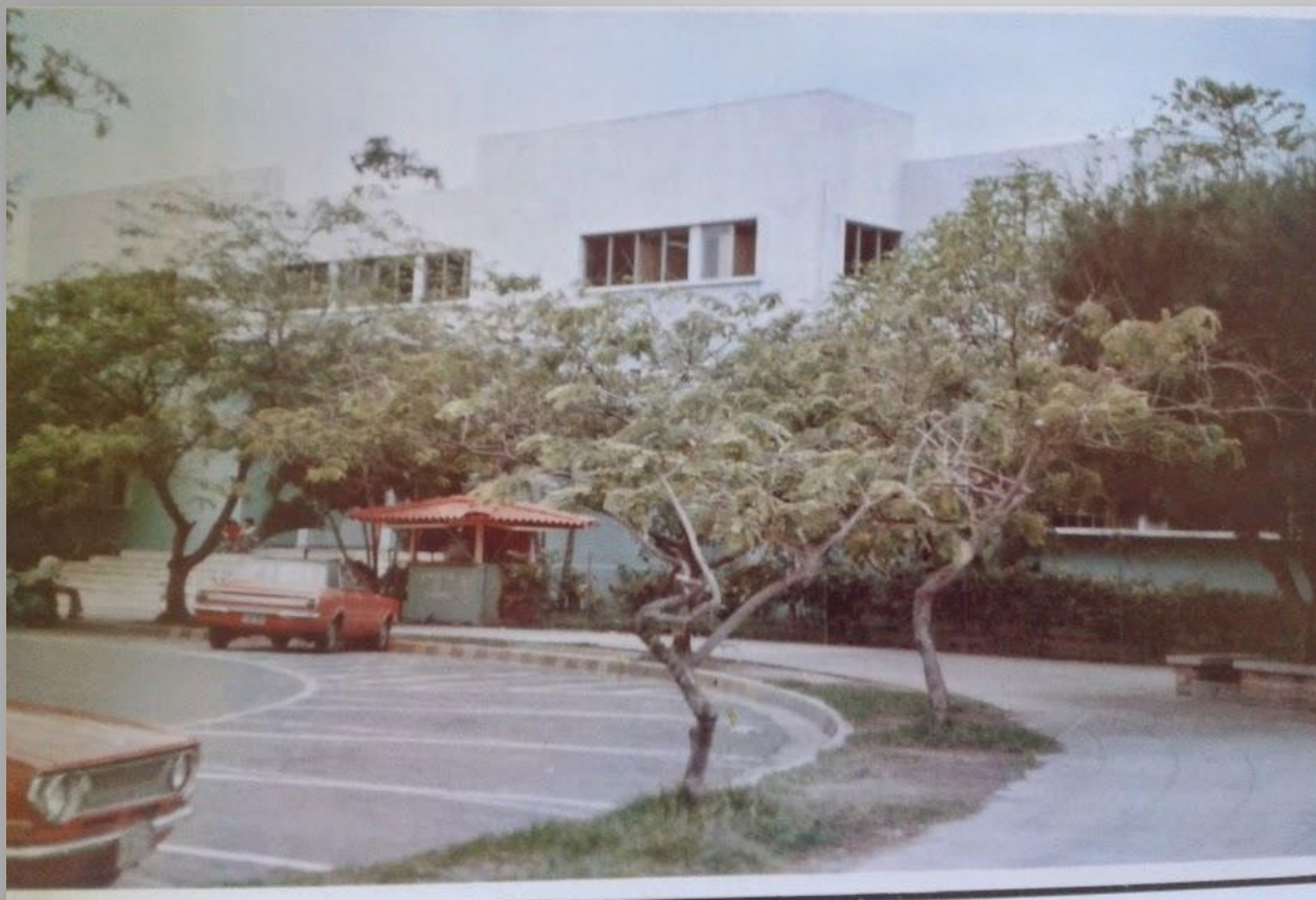
Fachada de la Facultad de Jurisprudencia y Ciencias Sociales, 1976

FACULTAD DE DERECHO. Al sistematizar la enseñanza superior en El Salvador allá por el año 1864, surgió la Facultad de Derecho (Jurisprudencia y Ciencias Sociales), de donde se deduce que ésta es la Facultad más antigua de la Universidad. En la foto, fachada del edificio de la Facultad de Jurisprudencia y Ciencias Sociales.