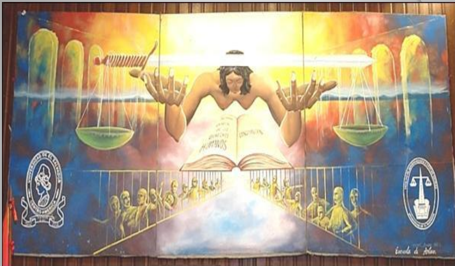
Mural del Auditorio de la Facultad