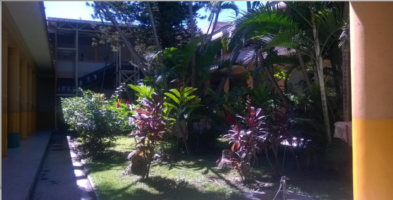
Jardín interno de la Facultad, 2014