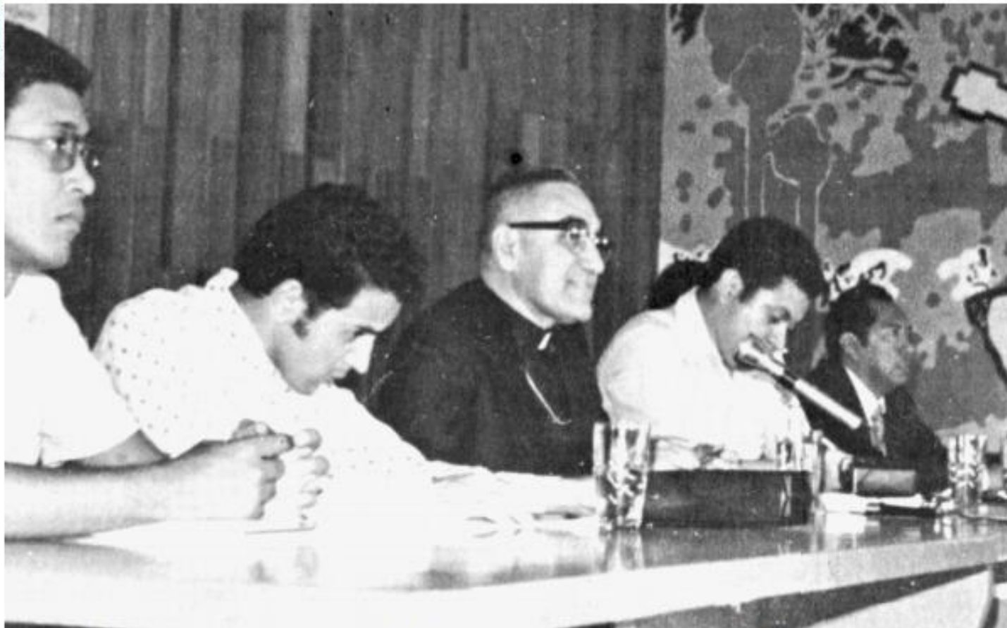
Monseñor Romero en una conferencia sobre Derechos Humanos en la Facultad de Derecho de la Universidad Nacional, 1980.

Monseñor Romero, en una conferencia sobre Derechos Humanos. Auditorio de la Facultad, 1980.