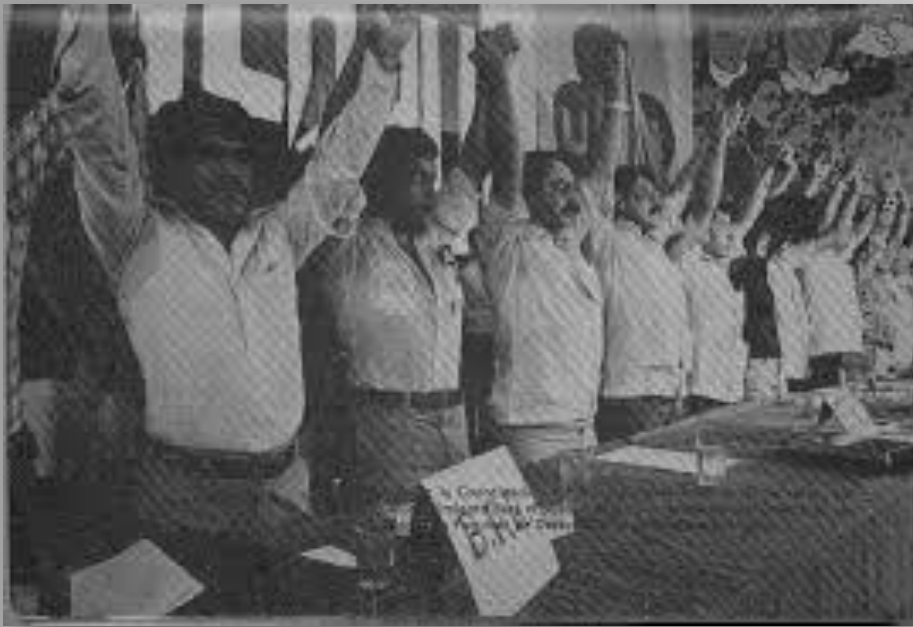
Conferencias del Frente Democrático Revolucionario, auditorio de la Facultad, 1980.