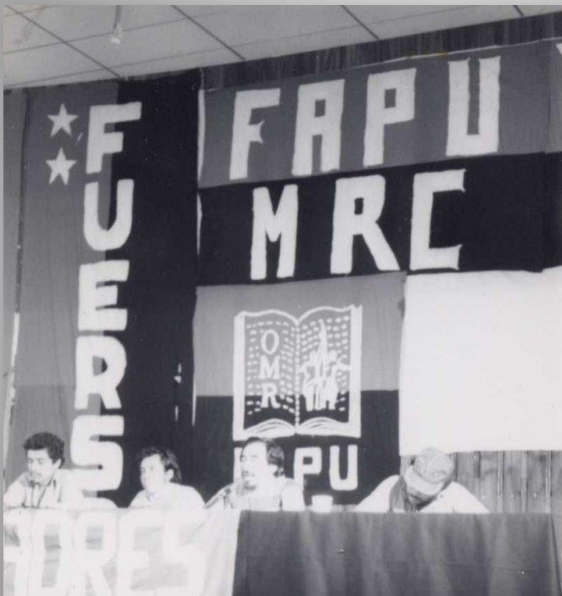
Reunión del grupo Frente Universitario Estudiantil Revolucionario Salvador Allende (FUERSA), en el auditorio de la Facultad, durante la década de 1970.